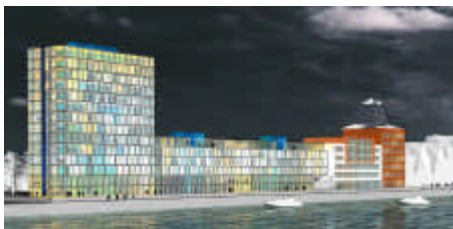
KAP AM SÜDKAI, Rheinauhafen, Köln