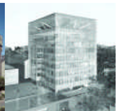
Dorma GmbH, Ennepetal

Ingenieure für Bauwesen, Tragwerksplanung, Sicherung und Sanierung historischer Bauten