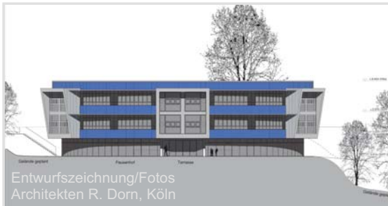
Entwurfszeichnung/Fotos Architekten R. Dorn, Köln