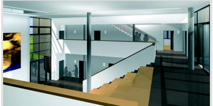
In Bau / Treppenhaus Architekten R. Dorn, Köln/Paderborn