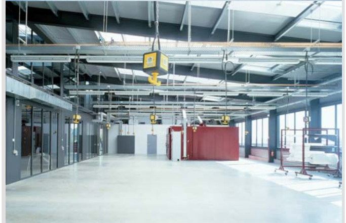
Innenansicht der Fertigungshalle