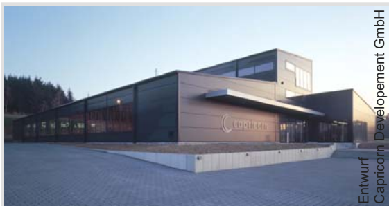
Entwurf Capricorn Development GmbH