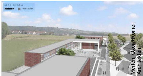
Merten, Oxen+Römer Architekten