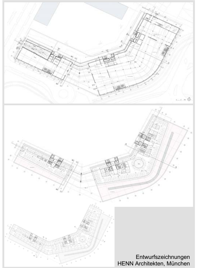
Entwurfszeichnungen HENN Architekten, München