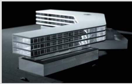
HENN Architekten, München