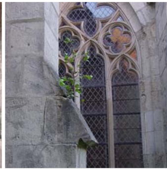
Prof. Dr.-Ing. Hempel & Partner, Braunschweig/Köln