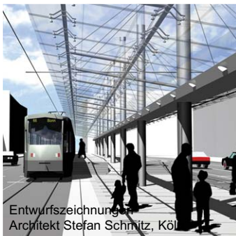
Entwurfszeichnung Architekt Stefan Schmitz, Köln